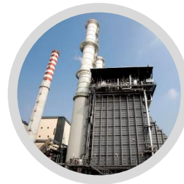
Generación de Energía