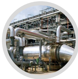
Procesamiento de Hidrocarburos