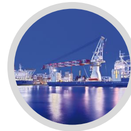
Industriales y Automotrices